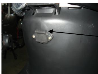
Akkumulátor töltő SP210-48V, AC220V 50Hz, Input power: 230W, output: DC59V 3. OA 1. Akkumulátor töltő csatlakozó pontja

Külső hőmérséklet csökkenésével a megtehető távolság egyenes arányban csökken, ez akár 50-60 %-os veszteség is lehet. A külső hőmérséklet emelkedésével az egy töltéssel megtehető távolság egyenes arányban növekszik, a megadott maximum megtehető távolságig az első oldalon leírt feltételek mellett.