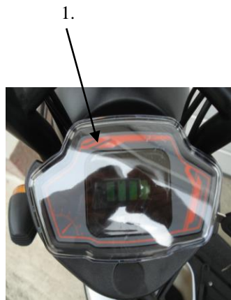
1. Akkumulátor töltöttség szintjelző műszer

A sebességmérő műszer adata tájékoztató jellegű.