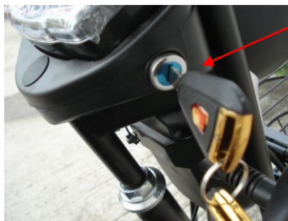
Gyújtáskapcsoló / „OFF” Kikapcsolt, „ON” bekapcsolt állapot